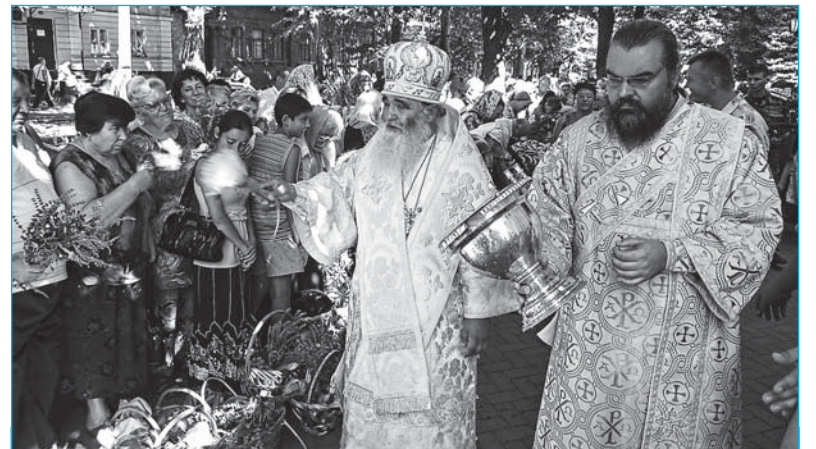
Освящение плодов в праздник Преображения Господня

Сегодня кафедральный собор Рождества Пресвятой Богородицы продолжает восстанавливаться под руководством Правящего архиерея, митрополита Питирима. Прделан огромный круг строительно-ремонтных работ. С внешней стороны установлены позолоченные центральный купол и кресты, перекрыта крыша, отремонтированы окна, восстановлен внешний фасад храма, благоустроен внутренний двор, отреставрирована кованая церковная ограда кафедрального собора, а также восстанавливается Соборный дом. Внутри храм оштукатурен и побелен, отремонтированы деревянные полы, а самое главное – установлен новый иконостас, имеющий перво-