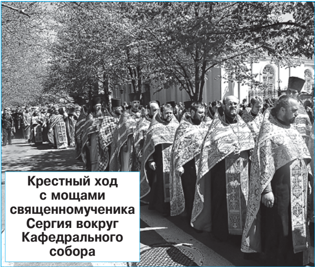
Крестный ход с мощами священномученика Сергия вокруг Кафедрального собора