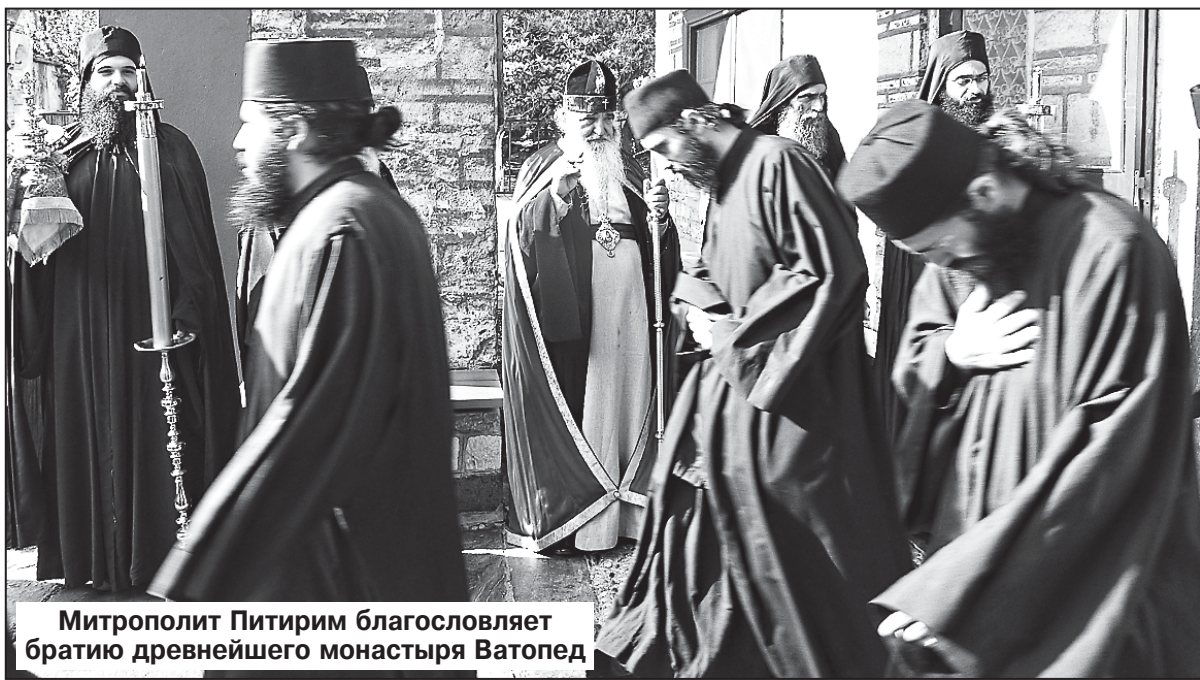
Митрополит Питирим благословляет братию древнейшего монастыря Ватопед