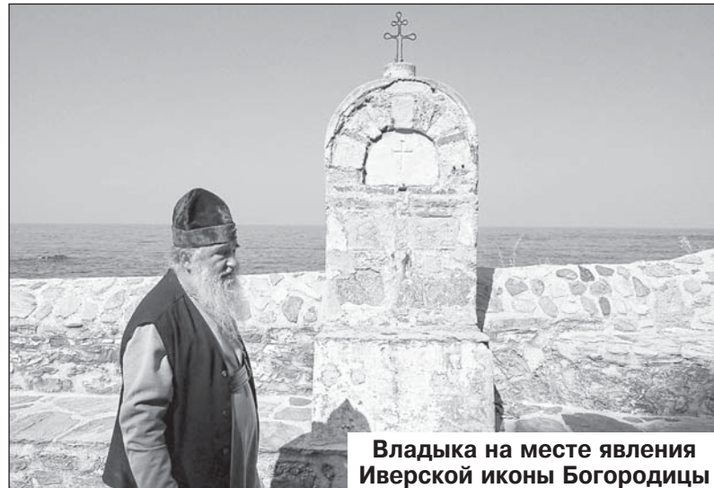
Владыка на месте явления Иверской иконы Богородицы

Хотелось поклониться святой земле Афона, Первому уделу Пресвятой Богородицы, месту, где подвизались и просияли многие светильники нашей Церкви. Хотелось помолиться и проникнуться молитвенным духом Афона.