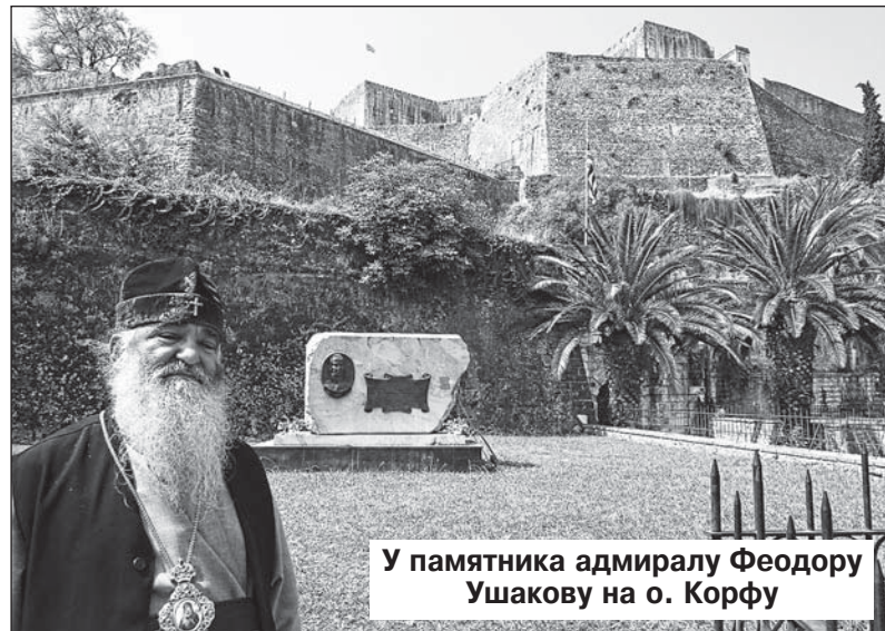
У памятника адмиралу Феодору Ушакову на о. Корфу

идут на молитву. Начинается всеобщая на всю ночь. А чуть начнет светать, сразу услышите глас: «Слава Тебе, показавшему нам свет» – и начинается утренняя. Далее чтение часов и совершается Божественная литургия с крестным ходом. После Богослужения торжественно и чинно все идут на трапезу, где продолжается молитва. После трапезы расходятся на недлительный отдых, но еще же есть у каждого свое послушание. Да! Афониты живут по строгому уставу. Большая часть жизни проходит в храме. Это образец молитвы. Не легко, трудно... Но, благодаря