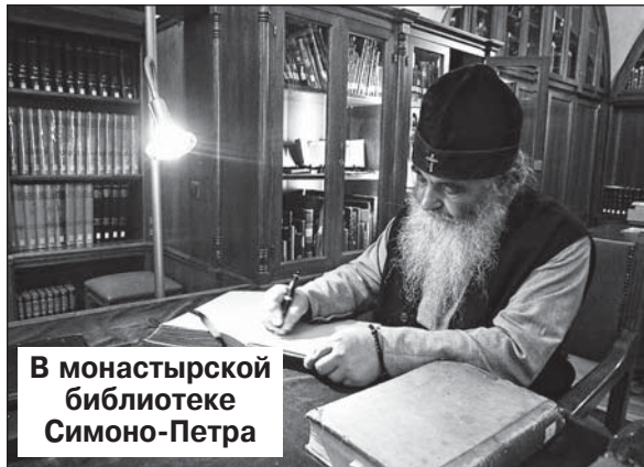
В монастырской библиотеке Симоно-Петра