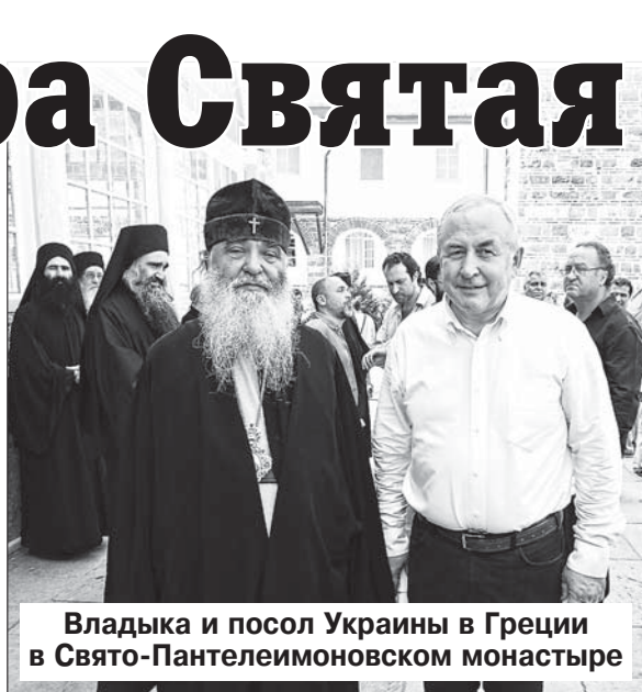
Владыка и посол Украины в Греции в Свято-Пантелеимоновском монастыре

– Нет. Божией милостью на обратном пути мы посетили остров Корфу (Керкиру). Побывали на празднике святителя Спиридона Тримифунтского, десница которого недавно была в Николаеве, почтили память святого адмирала Фео-