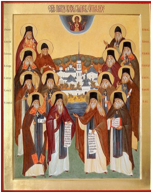
Икона "Собор преподобных Оптинских старцев"

24 октября (11 октября по старому стилю) Святая Православная Церковь чтит память Собора преподобных Оптинских старцев : Льва (+1841), Макария (+1860), Моисея (+1862), Антония (+1865), Илариона (+1873), Амвросия (+1891), Анатолия (+1894), Исаакия (+1894), Иосифа (+1911), Варсонофия (+1913), Анатолия (+1922), Нектария (+1928), Никона исповедника (+1931), Исаакия священномученика (+1938).