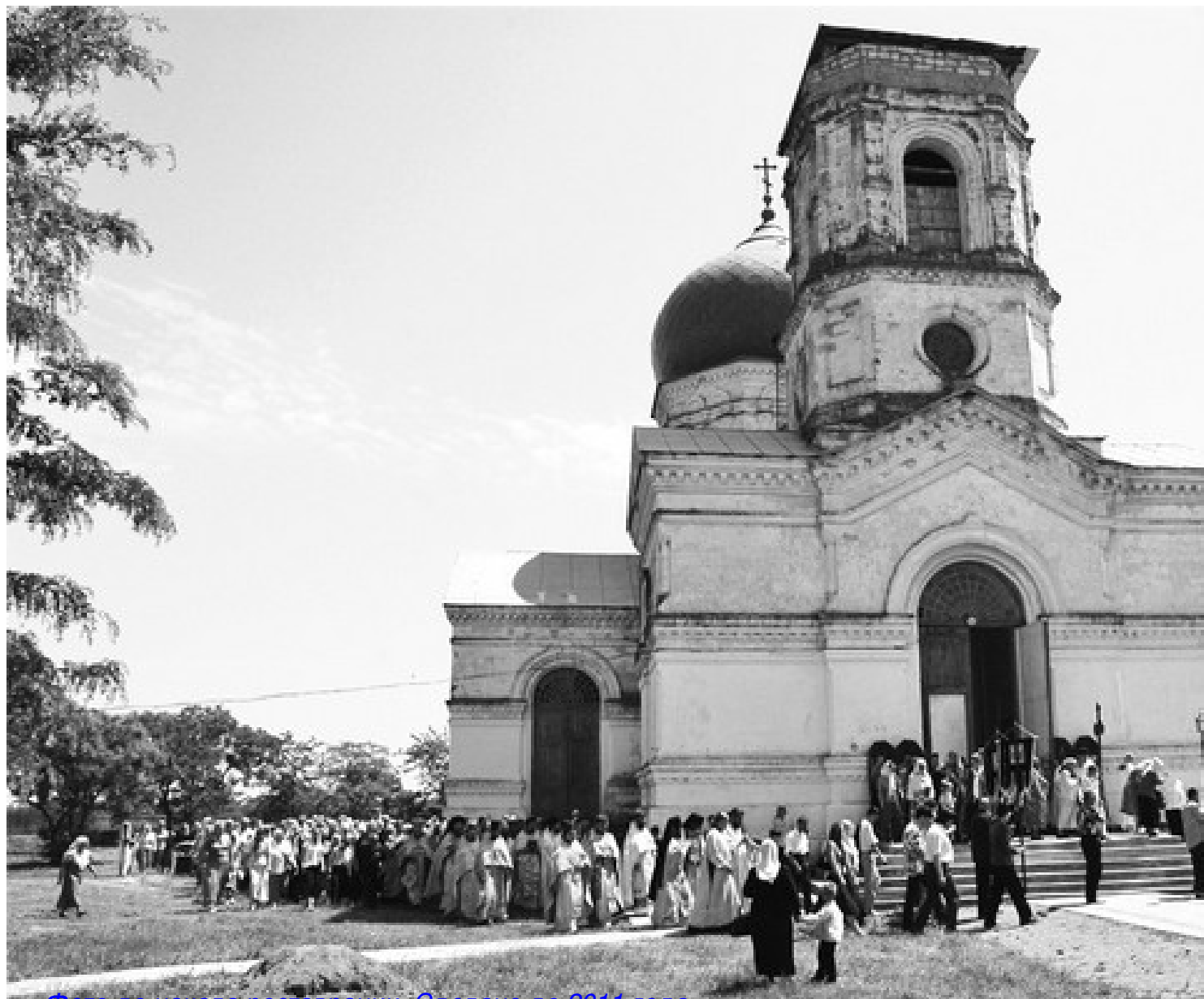
Фото до начала реставрации. Сделано до 2011 года.