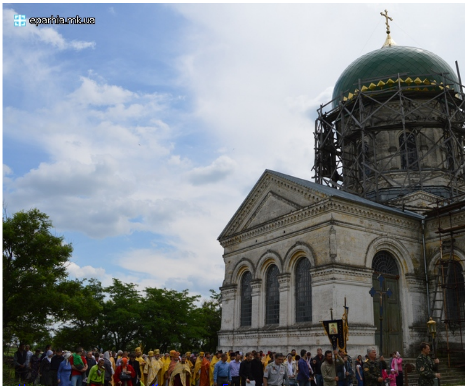
Церковь равноапостольных Константина и Елены