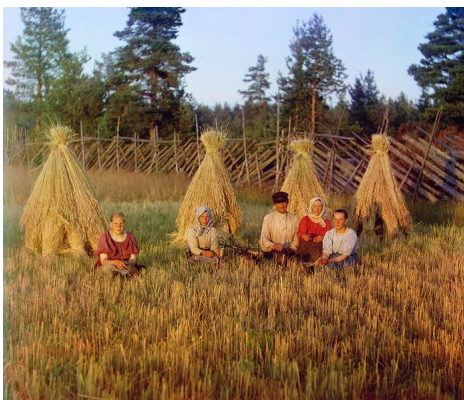
С. М. Прокудин-Горский. На жнитве. Цветная фотография 1909 года

Рассказывая подобные случаи из своей жизни в доме отца, Старец добавил: "Вот такого старца я хотел бы иметь: он никогда не раздражался, всегда был ровный и кроткий. Подумайте, полгода терпел, ждал удобной минуты, чтобы и поправить меня и не смутить."