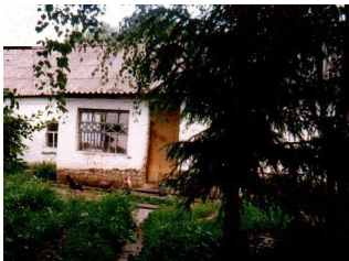
Дом, в котором жил преподобный Силуан