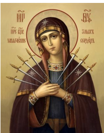
Икона Божией Матери "Умягчение злых сердец"

"Ты проглотил змею во сне, и тебе противно; так Мне нехорошо смотреть, что ты делаешь."