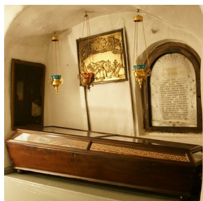
Источники: Повесть временных лет. О причинах бедствий и Повесть временных лет. О причинах бедствий