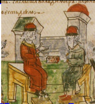
Источники: Повесть временных лет. О причинах бедствий и Повесть временных лет. О причинах бедствий